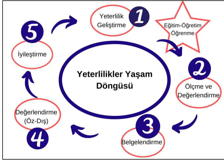
Şekil 1: Yeterlilik Yaşam Döngüsü

Her aşama açıkça tanımlanmış faaliyetleri içerir: