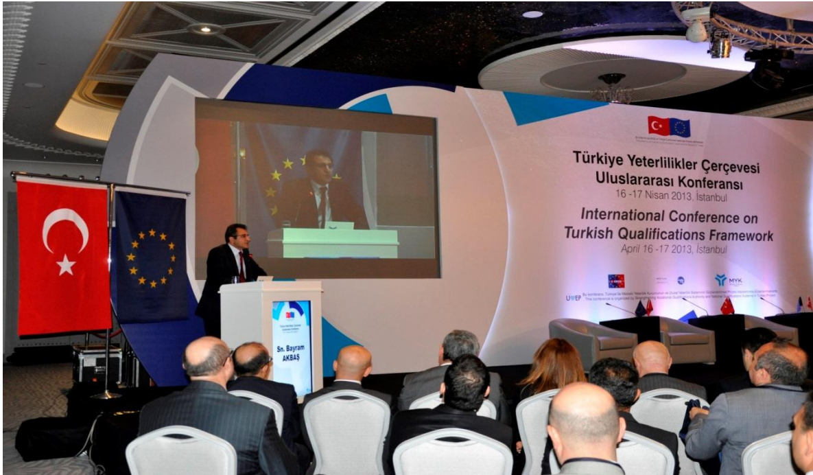
Resim 1-TYÇ Uluslararası Konferansı

16-17 Nisan 2013 tarihlerinde İstanbul'da düzenlenen TYÇ Uluslararası Konferansında TYÇ Belgesi yerli ve yabancı katılımcılara sunulmuş, katılımcıların görüş ve önerileri alınmıştır. Avrupa Komisyonu Avrupa Yeterlilikler Çerçevesi Danışma Grubu ve üye ülke temsilcileri başta olmak üzere 200'ü aşkın yerli ve yabancı katılımcının yer aldığı konferans MYK ve ülkemiz açısından başarılı bir etkinlik olmuştur.