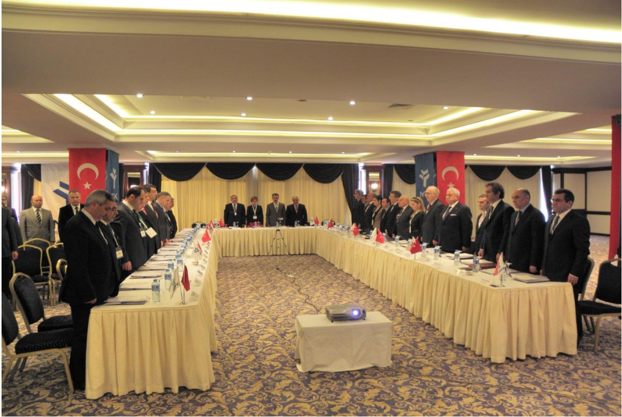
Resim 2-MYK VIII. Genel Kurul Çalışmaları