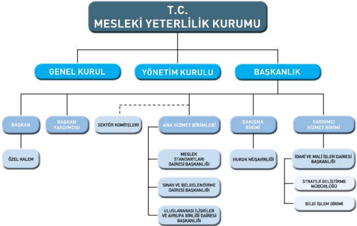
Şema-1: Teşkilat Şeması

MYK; Genel Kurul, Yönetim Kurulu, Sektör Komiteleri, Başkanlık ve Hizmet Birimlerinden oluşmaktadır.