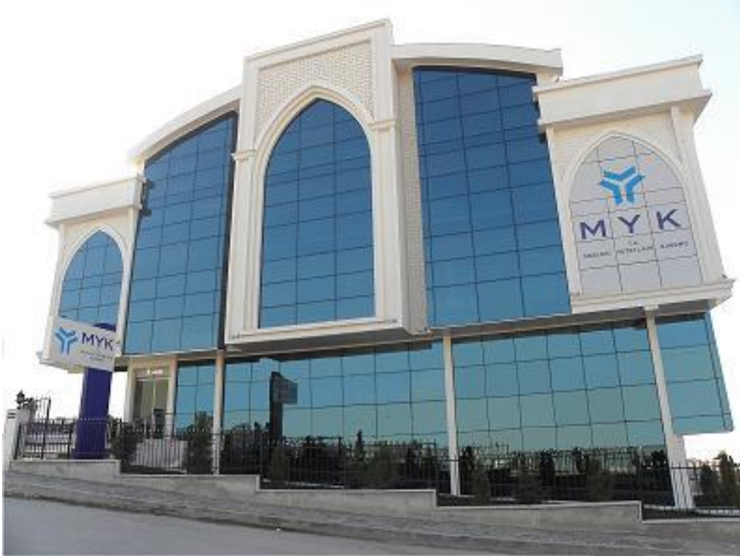
MYK Hizmet Binası

Kurumumuz Ziyabey Caddesi 1420. Sokak No: 12 Balgat-Çankaya/ANKARA adresindeki 6.600 m 2 alana sahip binada hizmet vermektedir.